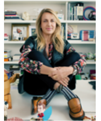
Patricia Urquiola Diseñadora y arquitecta

“Hemos trabajado sobre la hexagonalidad de la planta, que ya sugería una subdivisión de los espacios para diferentes tareas. A partir de ahí, hemos visualizado ambientes funcionales y configuraciones abiertas que originan un entorno heterogéneo pero operativo, donde puedan darse diferentes niveles de intimidad”, apunta la interiorista.