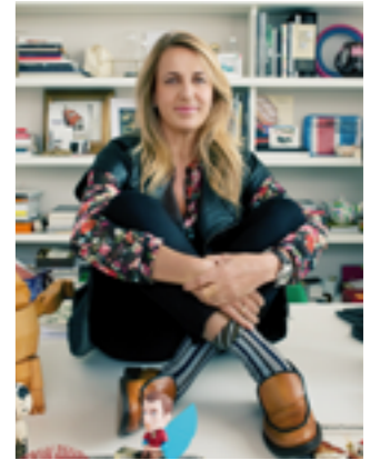
Patricia Urquiola Dissenyadora i arquitecta

"L'ambient és càlid i amable, com ho és en un espai domèstic. Per tant, he seleccionat colors suaus per a les cobertes principals, com fusta i ceràmica , que donen una segona llar a l'entorn general. Per la seva banda, el mobiliari aporta tons cromàtics més lluminosos i brillants , ja que l'espai ha de transmetre sensacions dinàmiques i positives ", comenta.