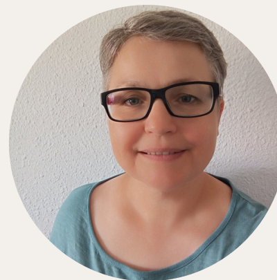
Vita Usuària de Kālida. Càncer de mama

Kālida va néixer per acompanyar, oferint espais per parlar, relaxar-se, aprendre, autocontrolar-se, fugir una estona si cal; per rebre una alenada d'aire fresc, lluny de l'entorn de la bata blanca.